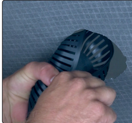
Pres ventilstudsens sammen, så undertaget er placeret mellem dæksel og underdel