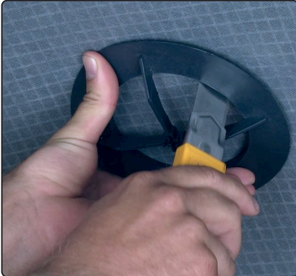
Marker og skær hul i undertaget